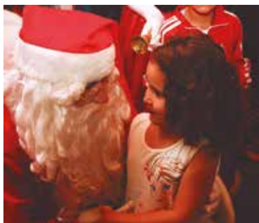
Natal em Campos do Jordão

Fique atento: em agosto serão abertas as reservas para Natal e Réveillon nas Colônias.