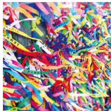
Foto participante do Talentos Fenae/APCEF enviada por Ana Carina Correa Gomes, da agência Além Ponte, Sorocaba

No site você também pode conferir o regulamento, todas as obras já enviadas e as premiações de cada etapa.